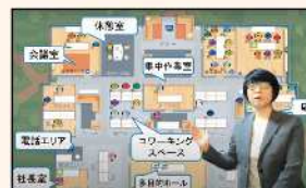
Sococoのクラウドオフィス運用を動画で紹介

年から日本での販売を開始しました。Sococoでは音声、映像、チャットでのコミュニケーションができ、特定の相手と話したい時は「相手を呼ぶ」ことも可能。Zoomなどの各種Web会議ツールと連携しているため、打合せがスムーズに始められます。オフィス内は自由にレイアウトでき「執務室」「会議室」「集中作業室」など目的に応じた部屋を設ければ、「誰が、どこで、何をしているか」一目で把握できます。さらに、ゲストとして招待すれば、社外の人との打合せも可能。テレワークのコンサルティングを本業とする同社では、手厚い導入サ