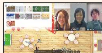
oViceを利用したクラウドオフィス

ニーズを受けて、サービス提供会社を設立すると、瞬間に多数の企業が導入。oViceでは、アバターから出る円の中にいる人に声をかけられ、アバターの近さや向きで声の大きさが変化します。会話している人に近づいて会話に参加し、遠ざかることで会話から離脱する、というリアルな状況を再現し、オンラインでは難しかった「雑談」を可能に。また、鍵をかけられる会議室での会議や全体へのアナウンスも可能です。背景や画像、動画などを自由にレイアウトでき、交流しやすいツールのため、通常勤務や打合せだけでなく、社内での懇親会やイベント