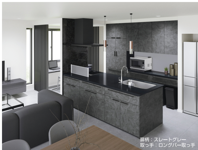
扉柄：スレートグレー 取っ手：ロングバー取っ手